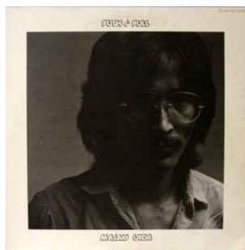
上田正樹 / Push & Pull

のバイブル音読帖に拙文を載せていただけることとなりました！素晴らしい『宇宙的なレコード』たちをたくさん紹介したいと思えます！