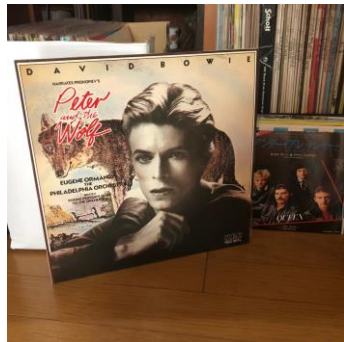
(暴れはっちゃく超太郎)