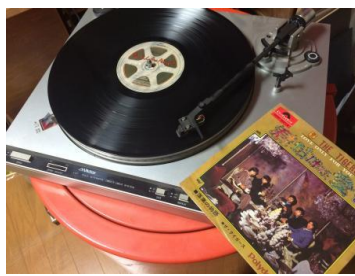
（暴れはっちゃく超太郎）