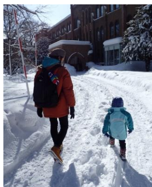
(暴れはっちゃく超太郎)

北海道のレコ屋巡りは次の機会になりそうです笑 インフルエンザが猛威を奮っておりませんが、どうか皆さまご自愛ください。