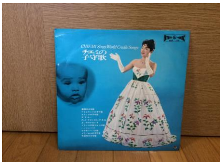
(暴れはっちゃく超太郎)

ただ、ただ、CDはCDの音でとて も良いと思います。精進あるの み！日進月歩です。 みなさまも急に涼しくなり体調崩 しやすい時期ですが、どうかお身 体に気をつけてください！