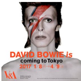
(暴れはっちゃく超太郎)